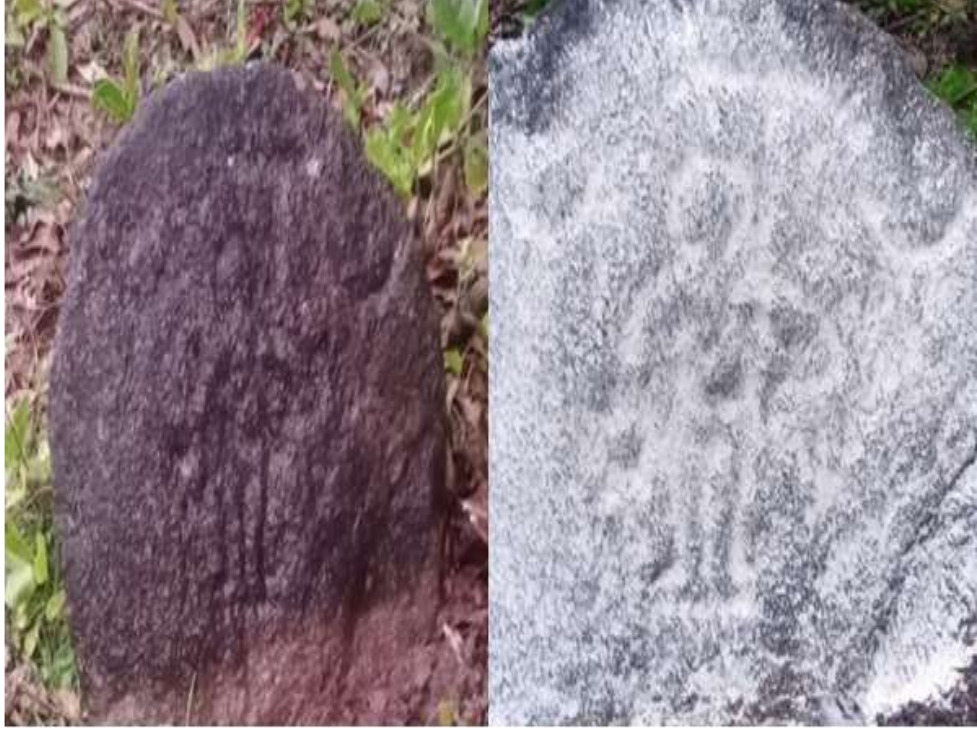
ಚಿತ್ರ 6: ವಾಪನ ಮುದ್ರೆ ಕಲ್ಲು