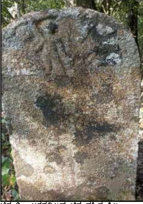
ಚಿತ್ರ 2 : ಅಕ್ಷರವಿಲ್ಲದ ಚಿತ್ರ ಸಹಿತ ಶಿಲ್ಪ