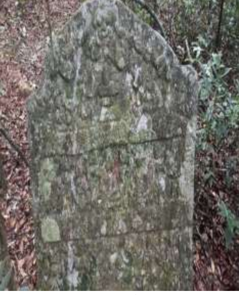
ಚಿತ್ರ 7 : ಮತ್ತೊಂದು ವೀರಗಲ್ಲು