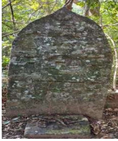
ಚಿತ್ರ 8 : ಪಲ್ಲಕ್ಕಿ ಶಿಲ್ಪವಿರುವ ಕಲ್ಲಿನ ಮುಂದೆ ಒಂದು ಪೀಠ