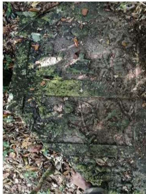
ಚಿತ್ರ ೫ ಹುಲಿಬೇಟೆ ವೀರಗಲ್ಲು