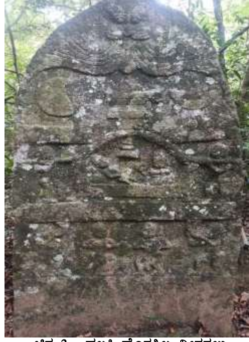
ಚಿತ್ರ 3 : ಪಲ್ಲಕ್ಕಿ ಹೊತ್ತಶಿಲ್ಪ ವೀರಗಲ್ಲು