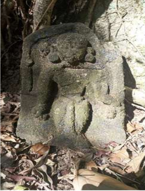
ಚಿತ್ರ 4 ಸಿಡಿಬೆಲೆ ಶಿಲ್ಪ