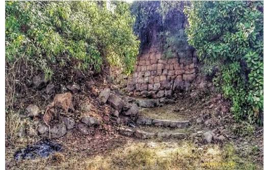
ಮಲಿಯೂರು ದುರ್ಗದ ಪ್ರವೇಶ