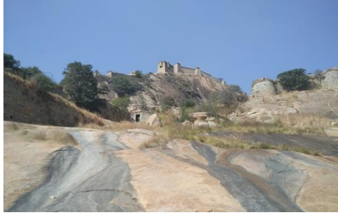
ಚನ್ನರಾಯ ದುರ್ಗದ ಕೋಟೆ