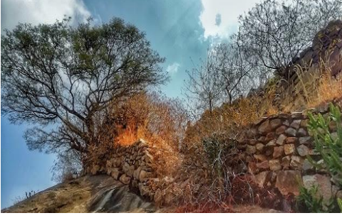
ಹುಲಿಯೂರು ದುರ್ಗದ ಕೋಟೆಗೋಡೆ