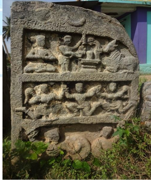
ಶಾಸನೋಕ್ತ ವೀರಗಲ್ಲು : ಎರಡು