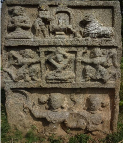
ಶಾಸನೋಕ್ತ ವೀರಗಲ್ಲು: ಒಂದು