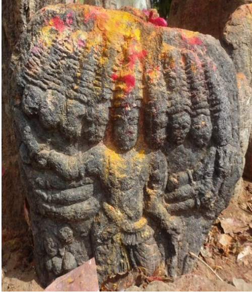
ಮೊದಲನೇ ರಾವಣ ಶಿಲ್ಪ